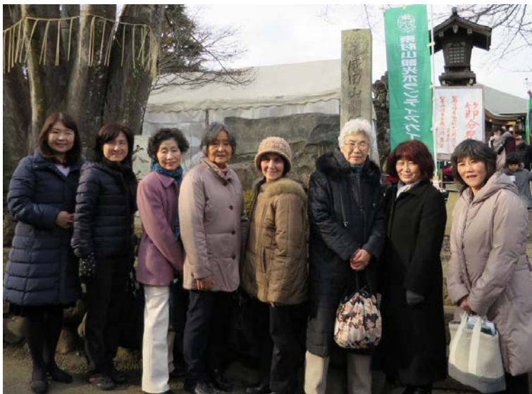
「大地」と「自然」のパワーと「絆」を感じて