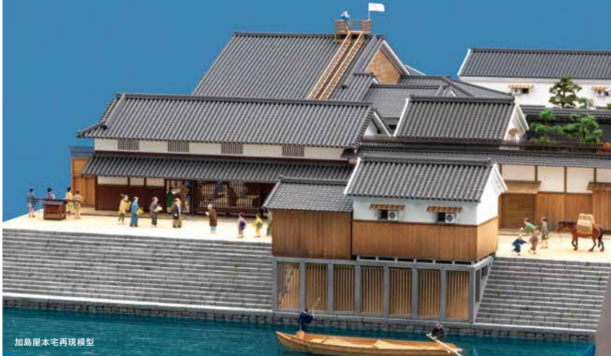
加島屋本宅再現模型