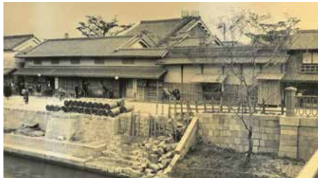
明治30年頃の加島屋本宅

2012年、大同生命が自らのルーツである加島屋に関する資料を研究者に公開したことをきっかけに、次々と加島屋の歴史資料が発見されました。創業120周年を迎えた2022年、この10年で新たに発見された資料をもとに、現在大同生命大阪本社ビルが建つ地に、元禄期(1693年ごろ)から大正時代まで存在した「加島屋本宅」を再現。さらに加島屋の中核ビジネスだった「大名貸し」や「堂島米市場」、そして豪商・加島屋のくらしを精巧な人形で再現しました。そこには、経済環境や顧客ニーズの変化に対応して自ら変革を続ける企業の姿がありました。