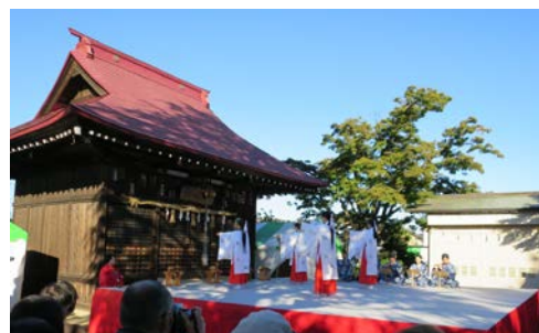
正福寺鎮守八坂神社 野口雅楽部の演奏による