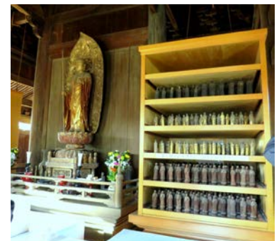
地蔵菩薩像と千体小地蔵尊像