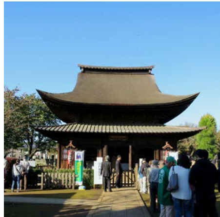
国宝の千体地蔵堂(禅宗様仏殿)